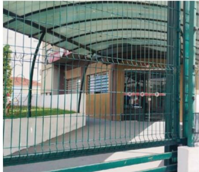
Prefeituras da região suspenderão atividades no ponto facultativo, também na próxima terça-feira (29), a partir da manhã.

No município, o trabalho nas repartições voltará ao normal